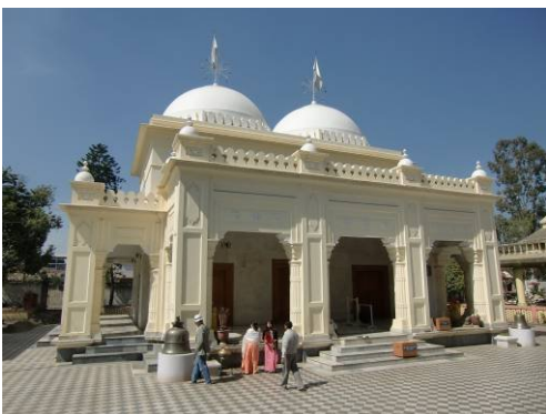
Bild: Tempel in Imphal

Besuch von Kangla (ehem. Britisches Fort), welches heute als eine Art Stadtgarten von Imphal genutzt wird. Hier konnten wir einige Sehenswürdigkeiten und den weltältesten Polo-Platz bestaunen. Weiterhin fuhren wir zu einem Tempel. Dort mussten wir die Schuhe ausziehen und barfuß gehen. Ein bestochener „Bettler“ achtete hierbei auf unser Schuhwerk.