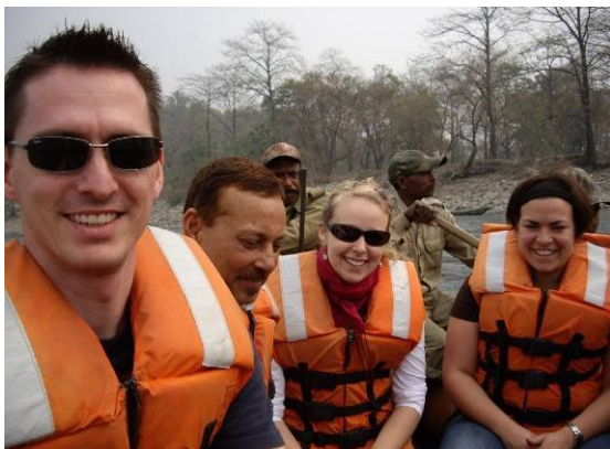
Bild: Flussfahrt auf dem Manas

Nach dem frühen Aufstehen (5:30 Uhr) kamen wir zum zweiten Mal auf unserer Reise in den Genuss auf Elefanten reiten zu können. Leider sahen wir diesmal keine Rhinos, sondern nur vereinzelt ein paar Hirsche und ein paar Pfauen. Trotzdem war es wieder sehr schön, die frühen Morgenstunden in einem Nationalpark in völliger Ruhe auf dem Rücken eines Elefanten zu genießen.