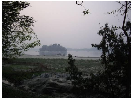
Bild: Fluss Brahmaputra, Guwahati

Der Nachmittag war Sightseeing (Völkerkundemuseum und Fluss Brahmaputra) gewidmet. Der Versuch zu Shoppen wurde erfolglos abgebrochen. Den Abend verbrachten wir wieder zusammen mit den Gastfamilien.