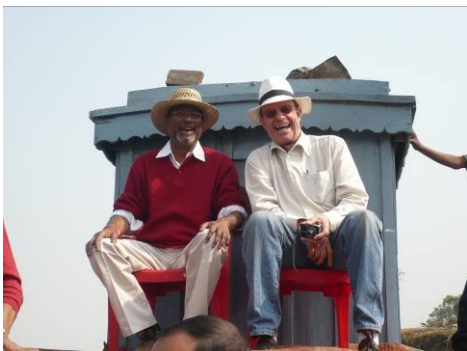
Bild: Eine Seefahrt die ist lustig ...

Wir hatten einen den fast gesamten Tag umfassenden Boat-Trip. Mit einer Art Boot wurden wir an Deck entlang des Flusses Brahmaputra gefahren. Auf einer großen Sandinsel in der Mitte des Flusses wurde ein Zelt errichtet und wir hatten Lunch.