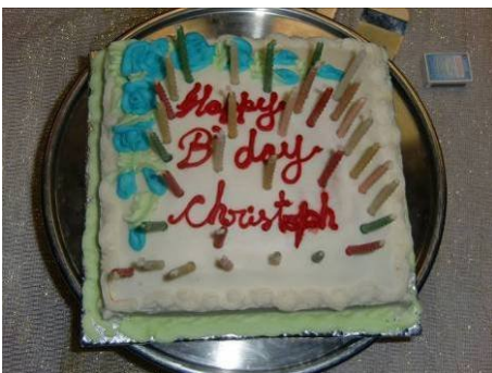
Bild: Geburtstagstorte mit zu vielen Kerzen

Da ich als Gast des add. DGP im Guesthouse der NEPA fürstlich versorgt wurde, konnte ich am gemeinsamen Mittagessen des restlichen Teams im "Pinewood Hotel" leider nicht teilnehmen. Die anderen Team-Mitglieder trafen dort eine Deutsche, die seit 6 ½ Jahren in Indien lebt. Bei Kaffee und deutschem Kuchen erzählte sie von Ihren bisherigen Erfahrungen und ihrem Projekt, bei dem Sie Kinder in den Slums betreut und deren Familien Wege zu einem besseren Leben in den Slums aufzeigt. Ihr Vorhaben ist es innerhalb der nächsten Jahre nach Nagaland umzuziehen und ihr Projekt dort weiter zu forcieren.