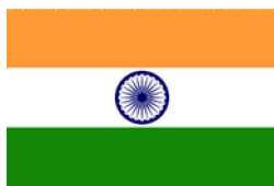
District 3240 India