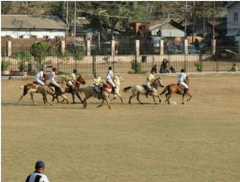
Bild: Poloturnier in Imphal

Besuch des Eröffnungsspiels eines Polo-Turniers ermöglicht. Hier saßen wir auf der Ehrentribüne und wurden fürstlich versorgt.