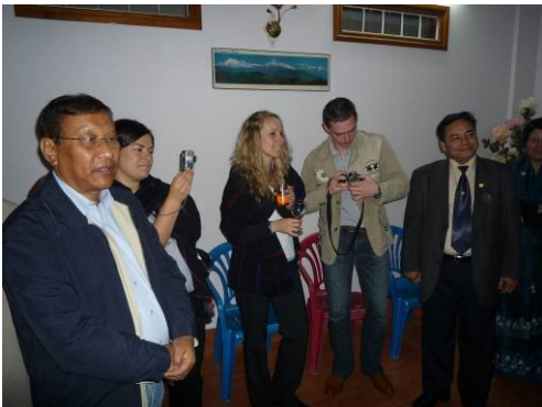
Bild: Rotarischer Abend in Imphal mit Distrikt Gouverneur Ajit Irom

den Tag zu verbringen. Wir nutzten diese Gelegenheit und trafen uns alle in einem Hotelzimmer. Es war ein super Tag fürs Team.