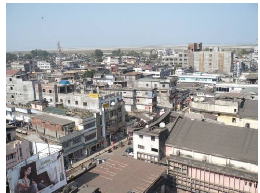
Bild: Blick über Dibrugarh

Der Tag ging mit einem Mittagessen bei einem rotarischen Freund weiter. Hier wurde traditionell vegetarisches Essen serviert. Um es kurz zu machen ... es schmeckte köstlich.