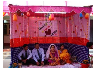
Bild: Ehepaar mit Trauzeugen

Schließlich ging es auf direktem Wege zu einer Dorf-Hochzeit, wo wir zu Mittag aßen. Auf dieser Dorf-Hochzeit waren wir einmal mehr die Attraktion schlechthin. Einige der Dorfbewohner, so wurde uns erzählt, hätten zuvor wohl noch nie Europäer gesehen. Ferner sei es eine große Ehre für das Brautpaar, dass Deutsche ihnen ihre Aufwartung