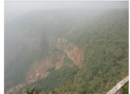
Bild: Nohkalikai Falls, Sohar