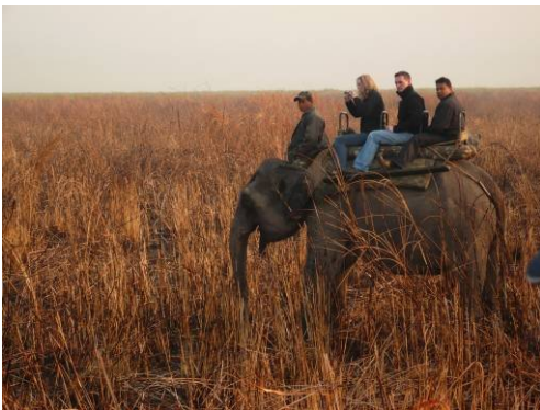
Bild: Elefantenritt im Kaziranga Nationalpark

Nach frühem Aufstehen (05:45 Uhr) in der Lodge ging es los zum Elefantenreiten, was sich als großer Spaß herausstellte.