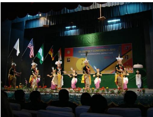
Bild: Kulturprogramm auf der Distrikt Konferenz

Das im Anschluss folgende „Fellowship-Programm“ verblüffte uns, da Manipur eigentlich ein trockener Staat ist.