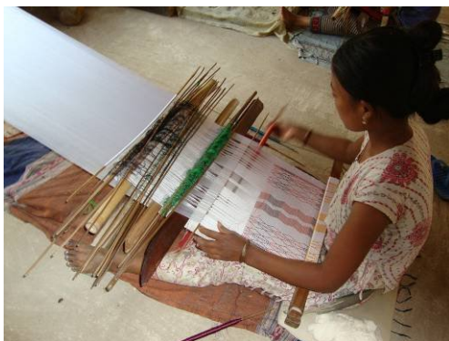
Bild: Weberei in Dimapur

Wir besuchten eine Schule, welche es armen Menschen (Frauen) ermöglicht, weben zu lernen und dadurch ihren Lebensunterhalt zu bestreiten. Erneut wurde ein Naga-Museum besichtigt. Im Anschluss daran gingen wir durch den „Stone Sculpture Garden“. Der Weg führte weiter zu einer Weberei. Hier bekamen wir tiefe Einblicke in die traditionelle und die „industrielle“ Webekunst der Inder. Einige Team-Mitglieder nutzten die Chance und erstanden einige Schals direkt vom Hersteller.