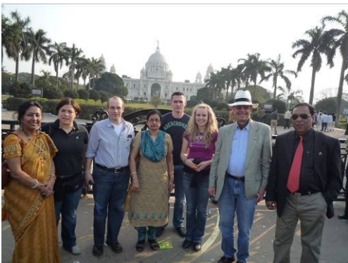
Bild: GSE Team und GSE-Chair vor dem Victoria Palast in Kalkutta

Dann endlich Einstieg und nach einem ruhigen Flug, Durchstarten in Dubai, da ein kleineres Flugzeug sich auf der Startbahn befand. Daher machten wir einen Rundflug über der mitternächtlichen Stadt. Der Flughafen ist immens und wir mussten länger als 23 Minuten zum Weiterflug marschieren.