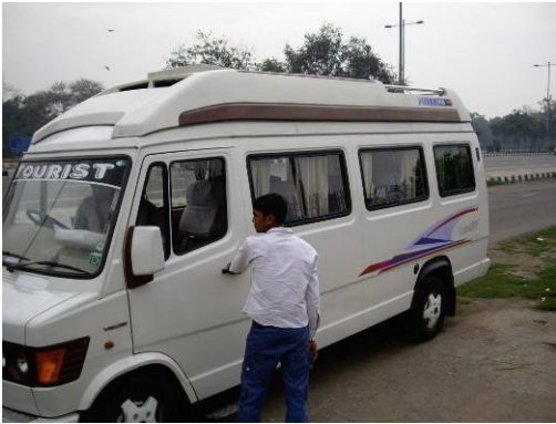
Bild: Tourbus für Agra und Delhi

Nach dem Frühstück und Packen aller Sachen trafen wir alle ( manche früher, manche später ) am Flughafen Guwahati ein. Um 14:20 verließen wir den Nord-Osten von Indien und das offizielle GSE-Programm war beendet.