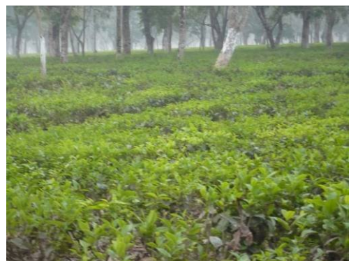
Bild: Teeplantagen am Straßenrand

Nach einem Herzlicher Empfang mit Essen ging es zu den Gastfamilien. Die neuen Gepflogenheiten, das Wohnen, die Schlafzimmer, die neuen Gerüche, es sind eine Fülle neuer Eindrücke, die auf uns zukommen und so manche Frage offen lassen.