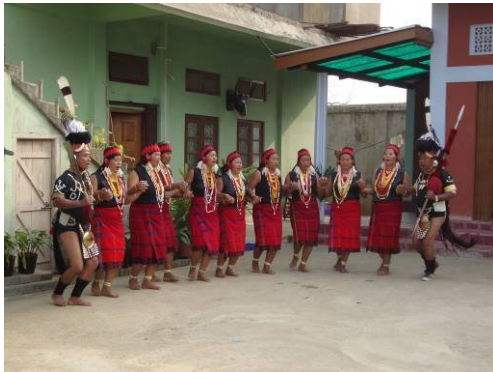
Bild: Traditioneller Nagatanz