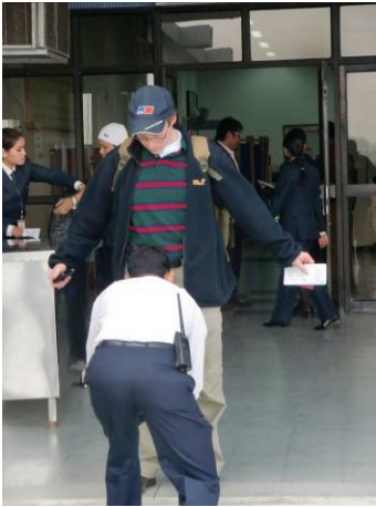
Bild: Security-Check - die Dritte - am Airport Imphal

Nach der Distrikt Konferenz sind wir am frühen Morgen des 15.02.2010 vom 'Classic Hotel' zum Flughafen Imphal aufgebrochen, um abermals einen domestic flight nach Guwahati zu nehmen. Es lief alles in gewohntem Rahmen ab. Wir waren schon langsam richtig meisterlich im Umgang mit Sicherheitskontrollen (die immer neuen Regeln folgten) und dem Ablauf der diversen Leibesvisitationen.