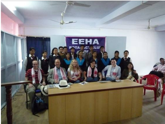
Bild: Besuch im Womens College