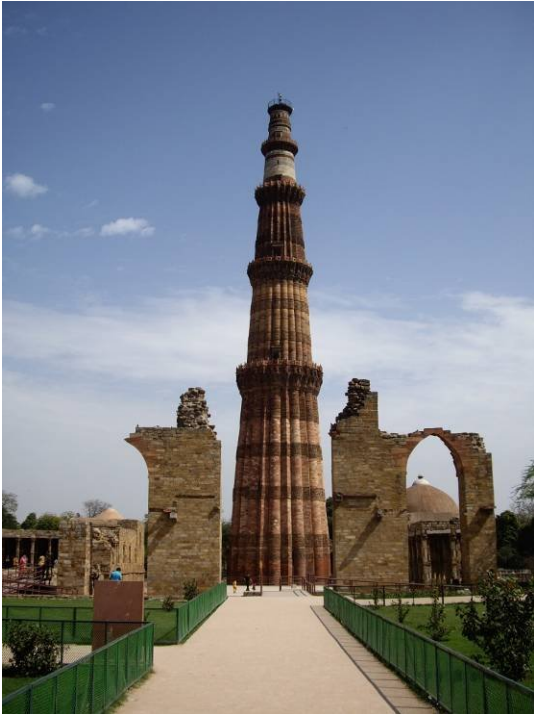
Bild: Qutub Minar

Der Tag war vollkommen dem Sightseeing in Delhi gewidmet. Wir besuchten das Indian Gate, das Rote Fort, den Lotus-Tempel und Qutub Minar.