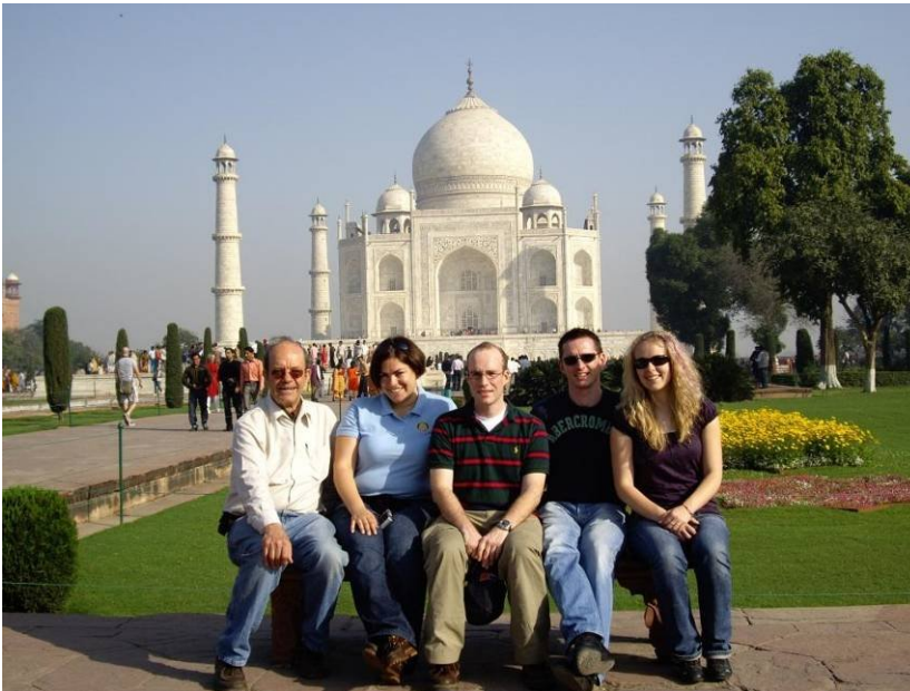
Bild: Das GSE-Team vor dem Taj Mahal

Nach dem Frühstück machten wir uns auf dem Weg zum Taj Mahal. Wir waren von diesem Bauwerk sehr beeindruckt und stellten fest, dass es zu Recht zu einem der Weltwunder gezählt wird.