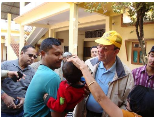
Bild: Immunisierung eines indischen Kindes im Rahmen des Polio-Projektes von Rotary

Seitens der AXIS Bank wurden wir im Gymkhana Club zu einem Dinner geladen. Der Verlauf des Abends war schlicht wiederum sehr angenehm. Leider zeigte sich zu vorgerückter Stunde erneut, dass man in Sachen „Host-Family“ gut aber auch besser dran sein kann. Dennoch waren alle Team-Mitglieder frohen Mutes und feierten solange es eben möglich war.