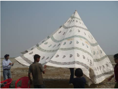
Bild: Aufstellen des Zelts auf der Flussinsel

Wieder Boden unter den Füßen hatten wir eine Fernseh-Pressekonferenz im Club-Haus.