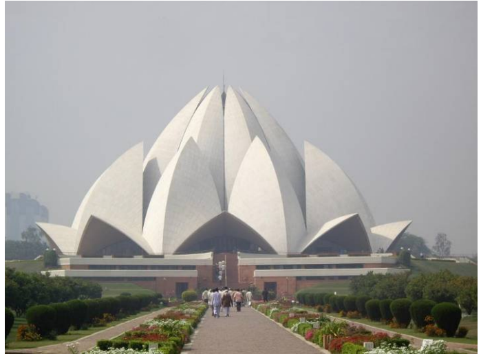
Bild: Der Lotus Tempel