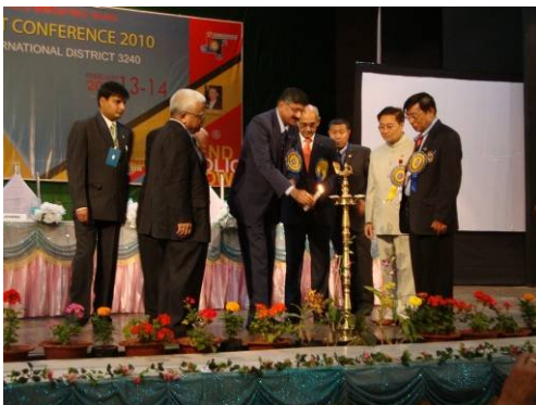
Bild: Eröffnung der XX. Distrikt Konferenz des Distriktes 3240 in Imphal