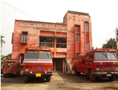
Bild: Feuerwehr Station in Dimapur