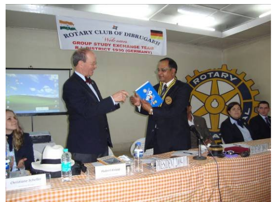
Bild: Wimpeltausch beim RC Dibrugarh

Nach diesem Empfang wurden wir direkt zum DHSK Commerce College verbracht, wo die gesamte Studentenschaft im großen Auditorium gespannt auf uns wartete. Nachdem wir mit tobendem Applaus empfangen worden sind, hatten wir eine Podiumsdiskussion und mussten umfangreiche Fragen beantworten.