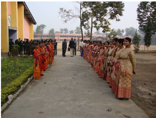
Bild: Empfang durch die SchülerInnen an der DPS

Der Tag startete mit einem Schulbesuch der örtlichen DPS (Delhi Public School), wo wir eine Interaction mit den Schülern, inklusive Gesang und Tanz, erleben durften. Die SchülerInnen hatten unzählige Fragen vorbereitet, die wir im Rahmen der Interaction nach bestem Wissen und Gewissen beantworteten. Es war einmal mehr eine sehr eindrucksvolle Erfahrung, mit indischen Schülern über die Unterschiede unserer Kulturkreise und Länder zu sprechen. Zu guter letzt mussten wir dann