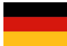
District 1930 Germany